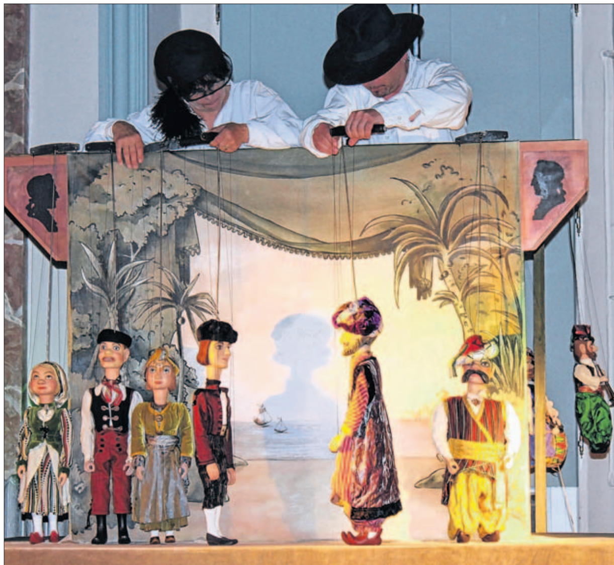
Donnerstag wurde der Vorbereitungsstand der Opernale vorgestellt – umrahmt wurde der Abend unter anderem vom Marionettentheater Blömel mit Auszügen aus „Die Entführung aus dem Serail“.